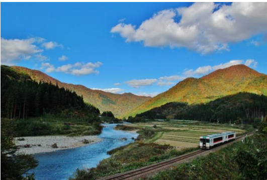
作品名：blue river 撮影場所：東長沢五本松（舟形町） 受賞者：高橋智宏さん （新庄市・男性）