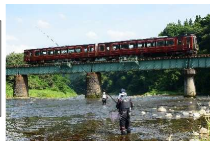
▼第8回優秀賞 「静と動」