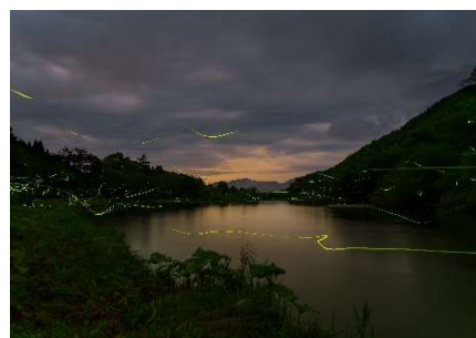
▼第8回最優秀賞 「幻想の光跡」