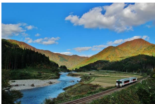
作品名：blue river 撮影場所：東長沢五本松（舟形町） 受賞者：高橋智宏さん （新庄市・男性）