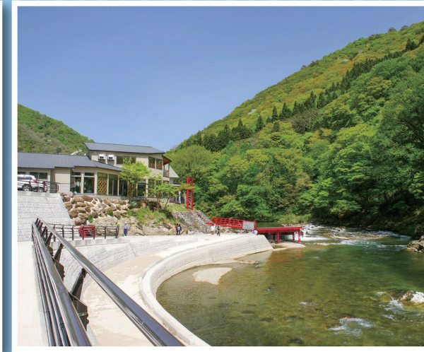
道の駅かもみとヤマ場