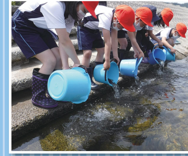
舟形小学校 稚鮎放流体験