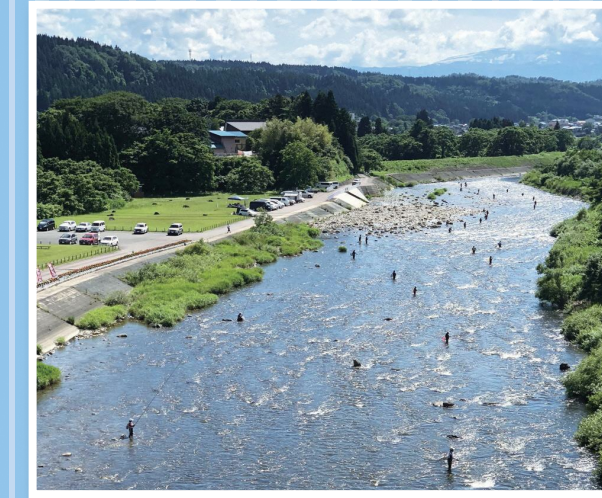
鮎釣りの光景 (一の関大橋下)