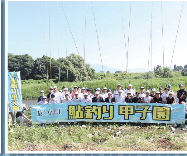
最上小国川釣り甲子園大会