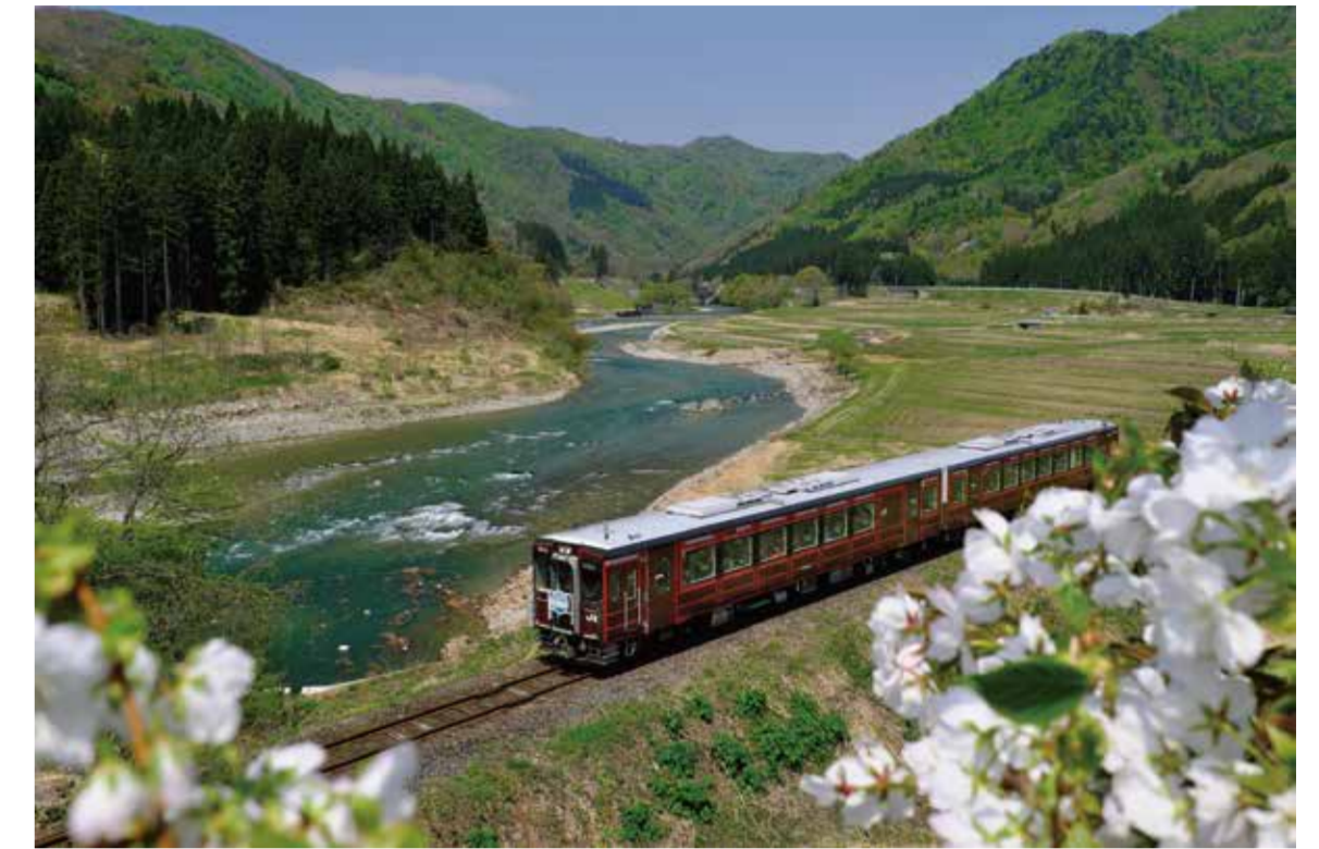
第7回最上小国川写真コンテスト 最優秀賞【陽春の最上路】