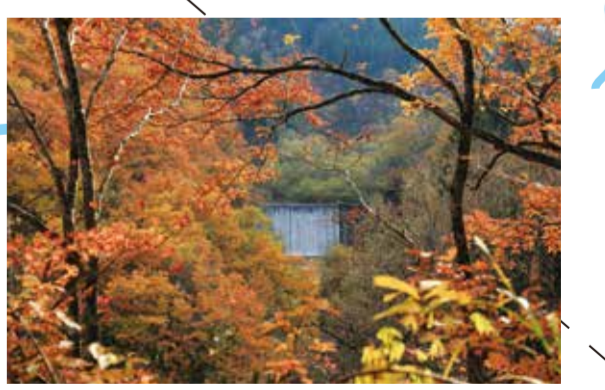
第7回最上小国川写真コンテスト【紅葉の中に】