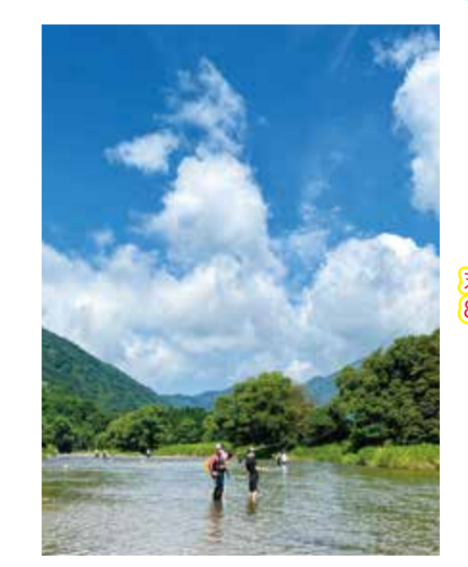
第7回最上小国川写真コンテスト 優秀賞【2022夏、はじめての鮎釣り】