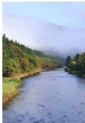
作品名：鮎里の秋 撮影場所：最上小国川（舟形町）