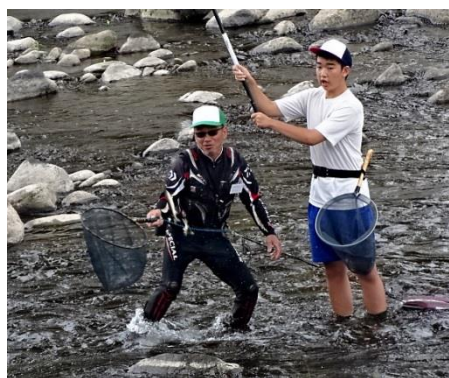
作品名：阿吽の呼吸でいいコンビ！ 撮影場所：一の関大橋付近（舟形町）