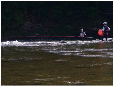
作品名：手応えを待つ 撮影場所：義経大橋上流（最上町）