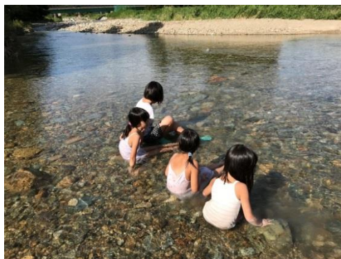
作品名：気持ちいいね！！ 撮影場所：鶴杉地区（最上町）