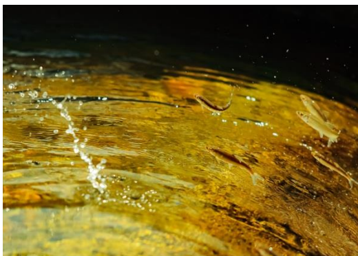
作品名：若鮎の湖上 撮影場所：長沢魚道（舟形町）