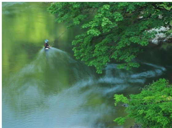
作品名：静寂 撮影場所：最上町瀬見