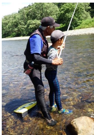
作品名：僕の師匠はじいちゃん！ 撮影場所：富長橋上流（舟形町）