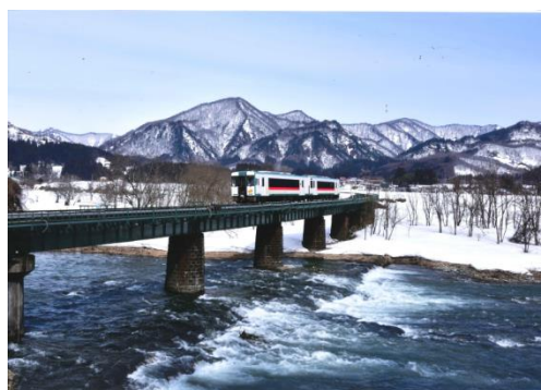
作品名：春の足音 撮影場所：東長沢駅西（舟形町）